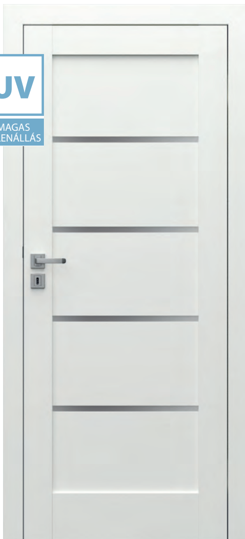
Porta GRANDE G.4, Fehér