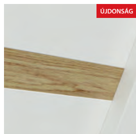
F0 - Tömör tölgyből készült de- koratív lemez, szintben az ajtólap felületével, vízszintes eresztes