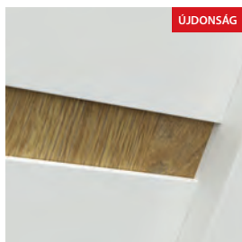
G0 modell - Dekoratív lemez (Portaperfect fólia vagy Természetes Tölgy furnér), az ajtólap felületéhez viszonyítva süllyesztve. Független erezettel opcionális - felár ellenében.