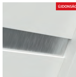
G0 modell - dekoratív lemez (szálcsiszolt alumínium) az ajtólap felületéhez viszonyítva süllyesztve. Független ereszettel opcionális - felár ellenében.