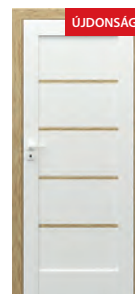
modell F.0 tömör tölgyből készült dekoratív lécekkel