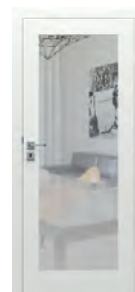
modell A.1 tükörrel