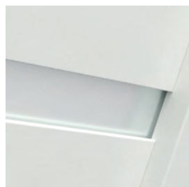
a G.4 modell üvegezése, az ajtólap felületéhez képest süllyesztett